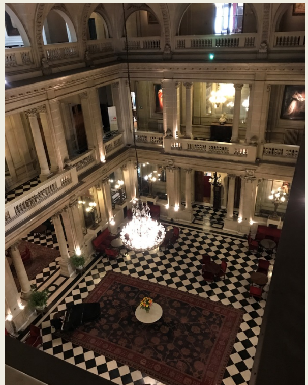
Salón principal Club de la Unión