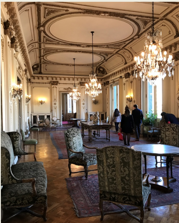
Salón 2do piso Club de la Unión